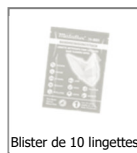
Blister de 10 lingettes