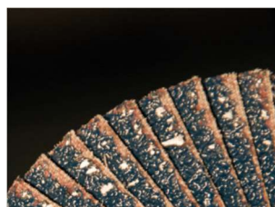
Sans SPRAY ABRA+